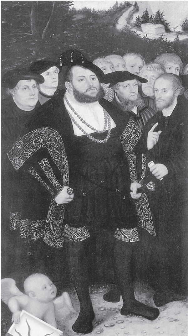
Kurfürst Johann Friedrich der Großmütige von Sachsen mit Luther, Spalatin, Brück und Melancthon. Gemälde von Lucas Cranach d. Ä., um 1530. Toledo, Ohio, Museum of Art